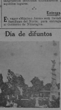
Vista panorámica del lado Occidental del Cementerio. (Entrada). En este lugar se encuentran ricos y artísticos túmulos mortuorios.