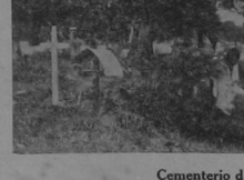
Don muchachos del pueblo, mal vestidos y harapientos, atreco con flores naturales a la tumba de la hermanita.