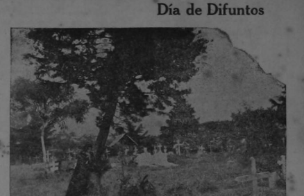
Debajo la sombra de un ciprés, y junto a la tumba de su hijo muerto en un accidente de trabajo, una madre sin amparo mira la tumba de su hijo. El dolor herido está que vuela más que las coronas costosas y las flores marchitas que sobre otras tumbas amontona la vanidad.

El año entrante ya no habrá Consulado ad-honorem en Nueva York; así lo dispuso el Congreso suprimiendo la partida correspondiente en el Presupuesto. Sin embargo con casi ningún puerto del mundo están grande el tráfico de este país, como New York. La mayor parte de nuestra exportación de café y casi toda la importación de maquinaria e implementos agrícolas se hacen en este puerto; es pues indispensable tener allí a alguien que no se puede pagar, un buen consul ad-honorem, que se interesa verdaderamente por el país y sus negocios, que conozca nuestra vida comercial y las relaciones con los Estados Unidos, que atienda a los costarricenses que llegan y salen y les de oportunos consejos y dirija sus primeros pasos.